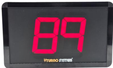
1 Pantalla de turno de 2 o 3 dígitos en el color elegido o 2 pantallas en caso de ser sistema master-esclava