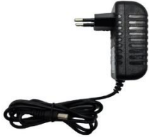
1 Fuente de alimentación por pantalla