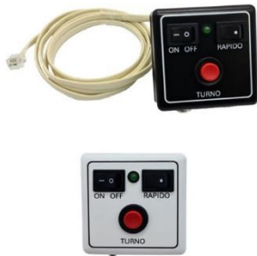
1 Pulsador de 3 funciones y 1,5m de cable si la pantalla es con pulsador o con pulsador y mando a distancia de 2 funciones