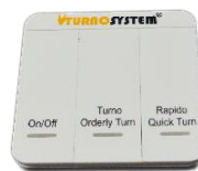
1 Mando a distancia de 3 funciones en caso de ser pantalla con mando a distancia de 3 funciones (on/off, paso lento y paso rápido)