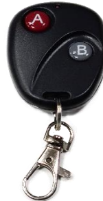
Mando a distancia de 2 funciones (paso lento y paso rápido) en caso de ser pantalla con pulsador y mando a distancia de 2 funciones