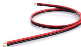
1 Cable de conexión entre pantallas con los metros pedidos en caso de ser un sistema de master-esclava